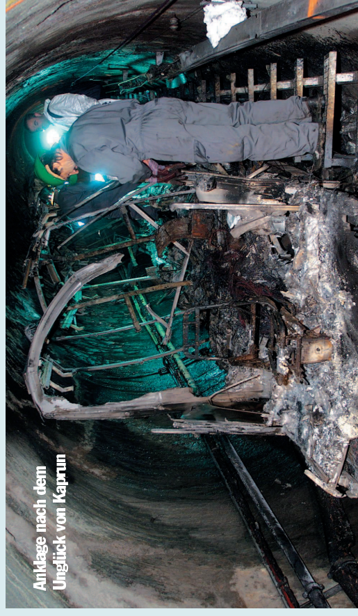
Anlage nach dem Unglück von Kaprun