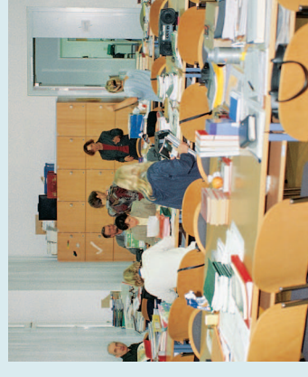
Forschungsarbeit ist kein Urlaub

„Die professionelle Unterstützung der GÖD-Rechtsabteilung hat mir zu meinem Recht verholfen.“