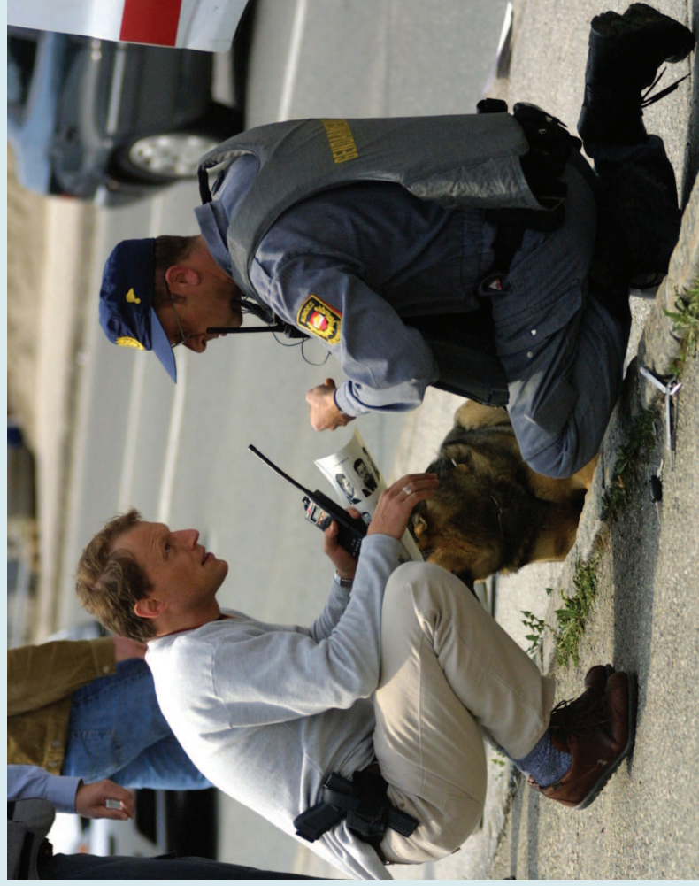
Exekutivbeamte: In Extremsituationen ist ein verlässlicher Rechtsschutz wichtig.

„Gerade für uns Exekutivbeamte ist Rechtsschutz eine wichtige Serviceleistung der GÖD, denn wir haben oft mit Menschen zu tun, die nichts mehr zu verlieren haben.“