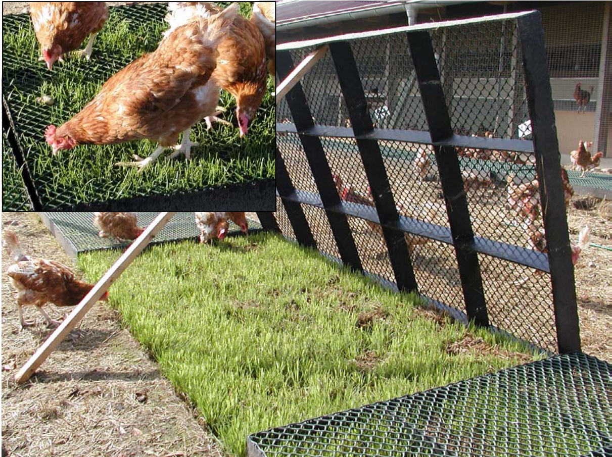
Abbildung 4: Rasenschutzgitter erhalten die Grasnarbe im Auslauf, bieten Grünfutter im stallnahen Bereich und verbessern den optischen Zustand des Auslaufes. Kleines Bild: Die Hennen picken das aus den Schutzgittern herauswachsende Gras ab.