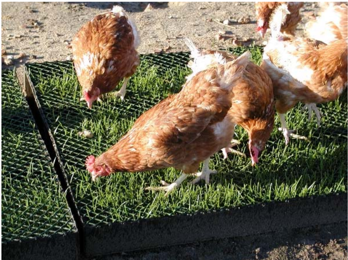
Abbildung 6: Die Hennen picken das aus den Schutzgittern herauswachsende Gras ab.

Das vollständige Literaturverzeichnis und weitere Informationen können über die Landwirtschaftskammer, Frau Elbe ( u.elbe@lwk-we.de ) bezogen werden.