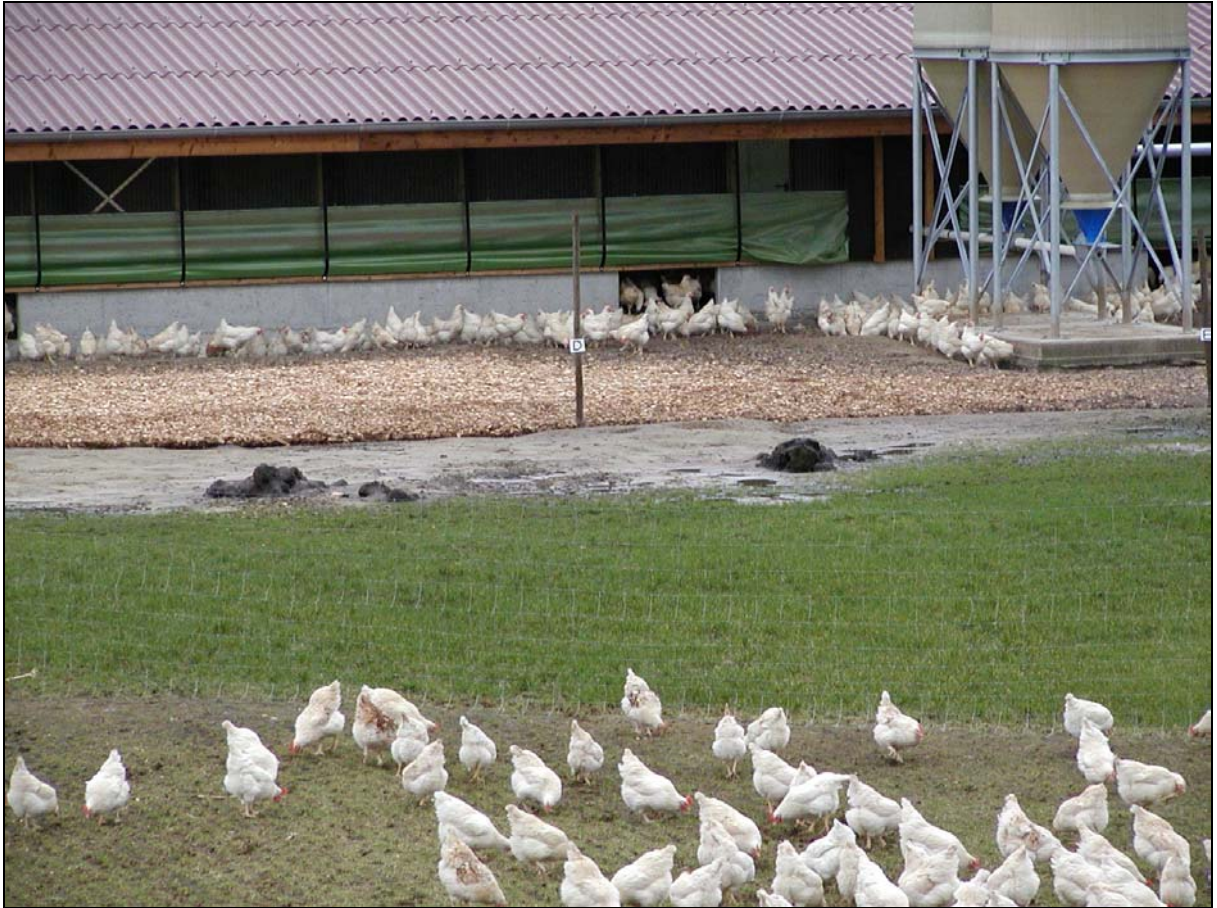
Abbildung 3: Hinten: Holzhackschnitzel im stallnahen Bereich verhindern die Bildung von unhygienischen Pfützen (Mitte). Vorne: Wechselweide.