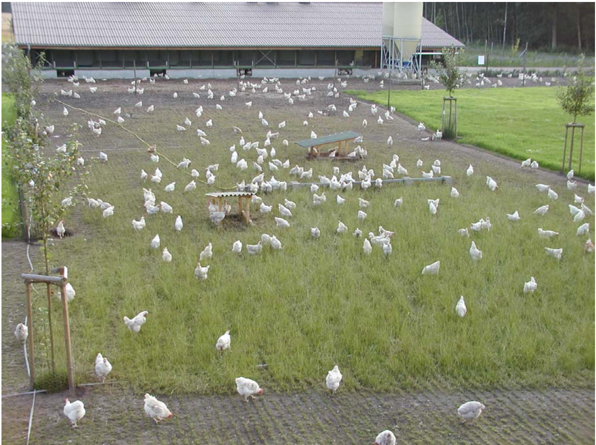
Abbildung 5: Mit Schattendächern, Tränken und Apfelbäumen strukturierter Wechsellauslauf.

Um die gleichmäßige Verteilung der Hennen im Auslauf zu fördern, sollten die hinteren, überständigen Grasbestände gemäht oder geschlegelt werden, damit diese Bereiche wieder von den Hennen angenommen werden. Könnte der Aufwuchs abgefahren werden, würde ein tatsächlicher Nährstoffentzug stattfinden. Diese Maßnahme wäre die natürlichste Form des Nährstoffmanagements. Die Verordnung (EWG) Nr. 1907/90 (Vermarktungsnorm für Eier) läßt allerdings die Nutzung zu anderen Zwecken (z.B. Beweidung durch andere Tierarten, Getreideanbau, Futterbau) nicht zu.