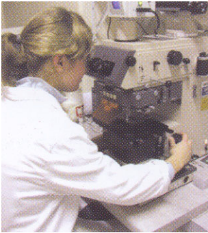
Abbildung 2: Lebensmitteltechnikerin

Beschriften Sie Ihre Tabellen immer mit der Beschriftungsfunktion von Word oder Open-Office. Erstellen Sie niemals Textrahmen für Beschriftungen.