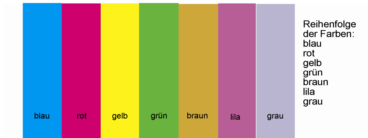
Abbildung I: Abbildung mit Farben

Hier noch einige Beispiele für Abbildungen mit Farbe