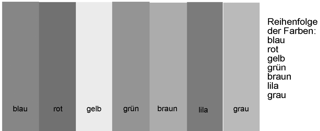
Abbildung II: Abbildung wie oben in Graustufen

Hier sehen Sie dieselbe Abbildung, wobei die Farben in Graustufen umgewandelt wurden. Dabei ist die Schrift auf dem roten und lila Hintergrund sehr schlecht zu erkennen, auf blauem Hintergrund ist die Schrift einigermaßen erkennbar, und auf gelbem Hintergrund ist die Schrift, dank der sehr hellen Graustufung, sehr gut zu erkennen.