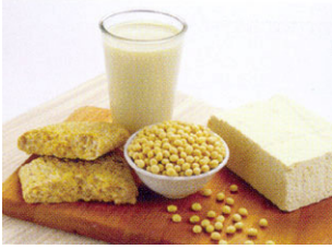
Abbildung 1: Lebensmittelprobe

Vor allem bei der Verwendung von vielen Abbildungen ist es besser, wenn Sie die Fotos nicht einbetten (embedden) und immer ein Original der Abbildung für eine eventuelle spätere (Nach-)Bearbeitung extra sichern, am besten in einem eigenen Verzeichnis.